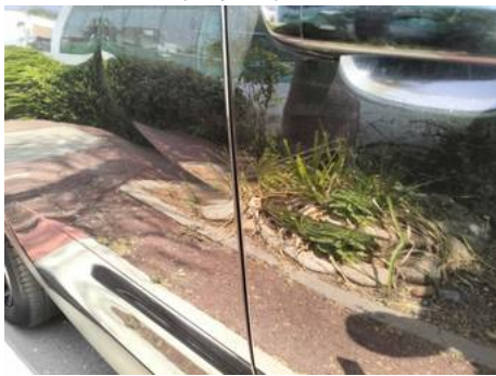
Porte arrière droite (Impact)